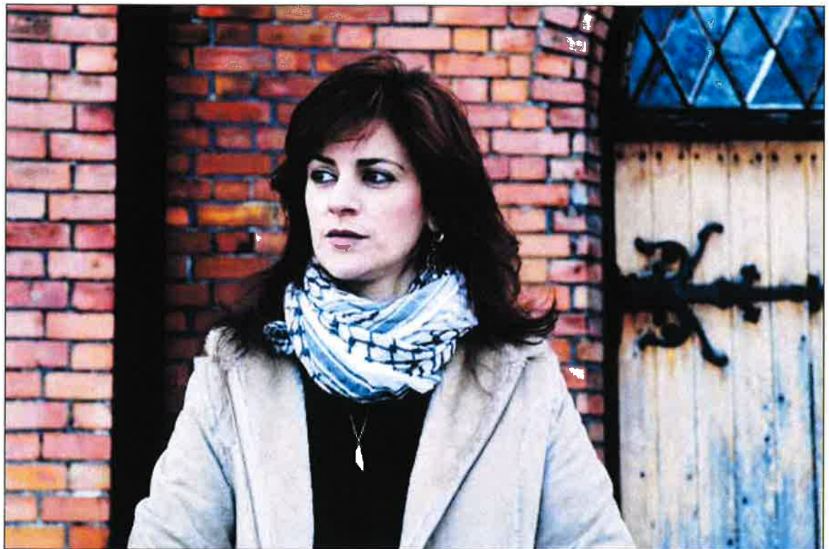
MOTSTANDSKAMPSANGER: Rim Banna, avbildet på et av mange Norgesbesøk, i 2008. Det langvarige samarbeidet med Kirkelig Kulturverksted, og norske musikere som Bugge Wesseltoft, setter preg på hennes musikalske testamente.